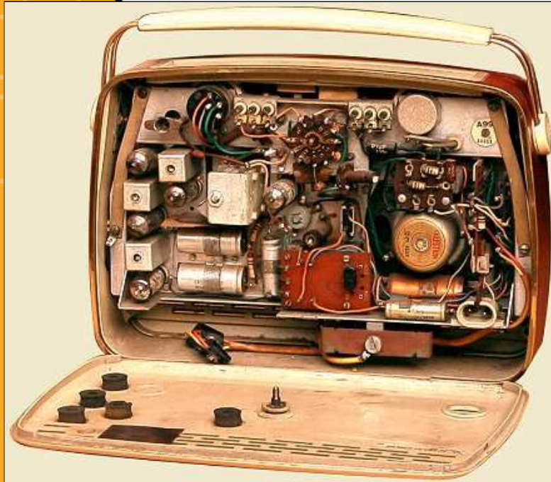
Bush MB 60 (1957)