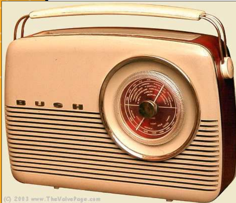
Bush MB 60 (1957)