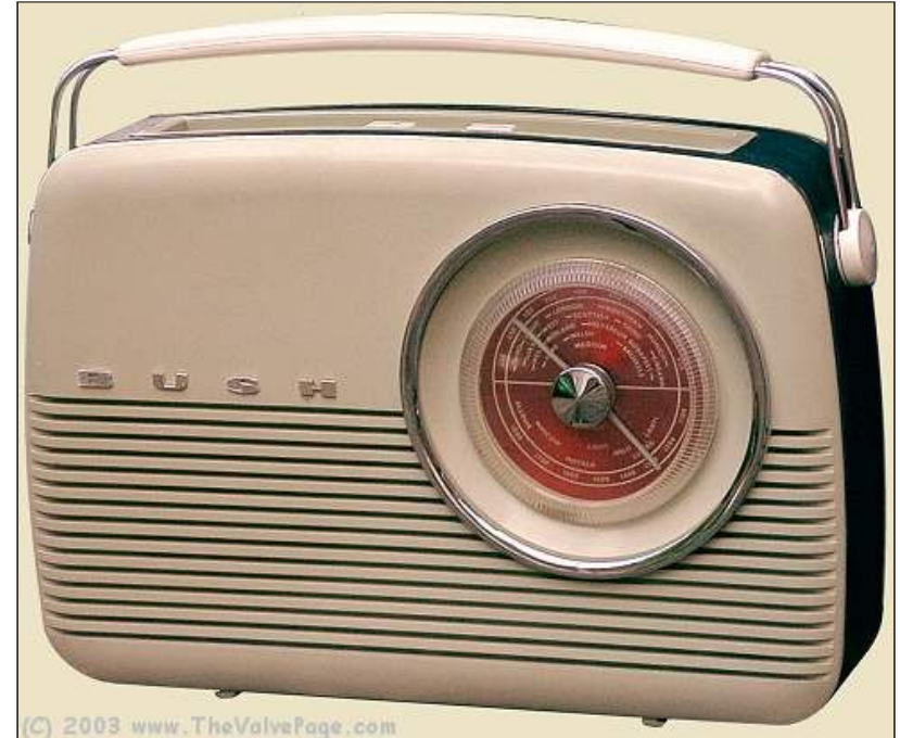
Bush TR 82 (1959)